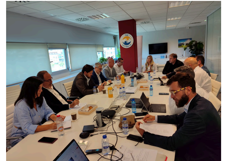
21 de maig de 2024. Reunió i dinar Junta Directiva a Luz Inclusiva.