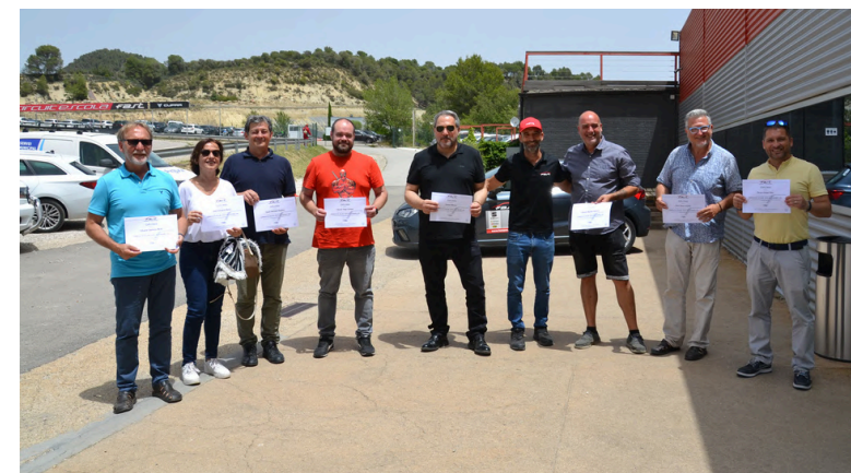
28 de juny de 2024. Curs de conducció.