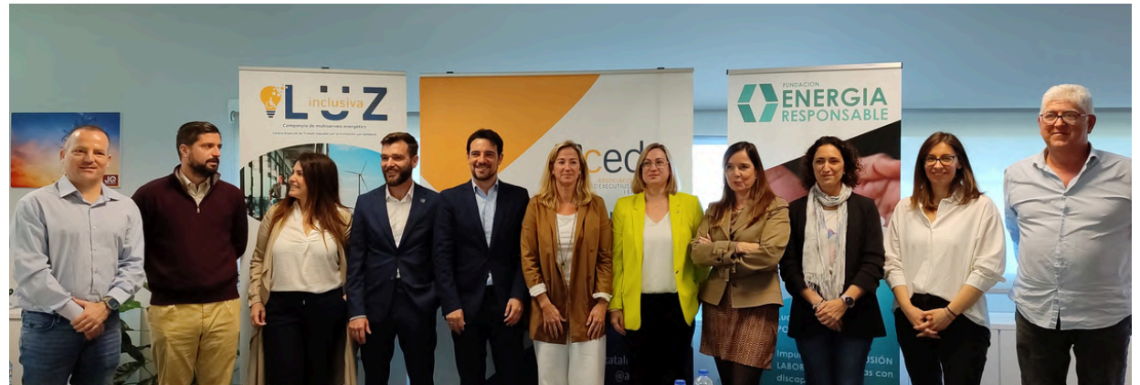
16 d'abril de 2024. Col·loqui amb l'Ill·Im. Sr. Manuel Reyes, alcalde de Castelldefels.