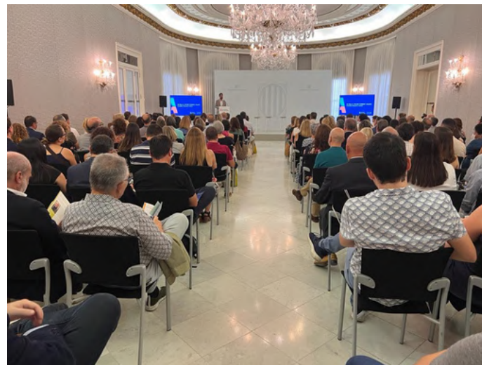
21 de juliol de 2023. Acte de reconeixement de les empreses per la formació contínua CONFORCAT A MIDA.