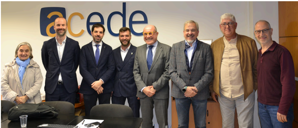
11 d'abril de 2024. Esmorzar executiu ACEDE amb el Sr. Aleix Cubells, director general de Fons Europeus i Ajuts d'Estat.