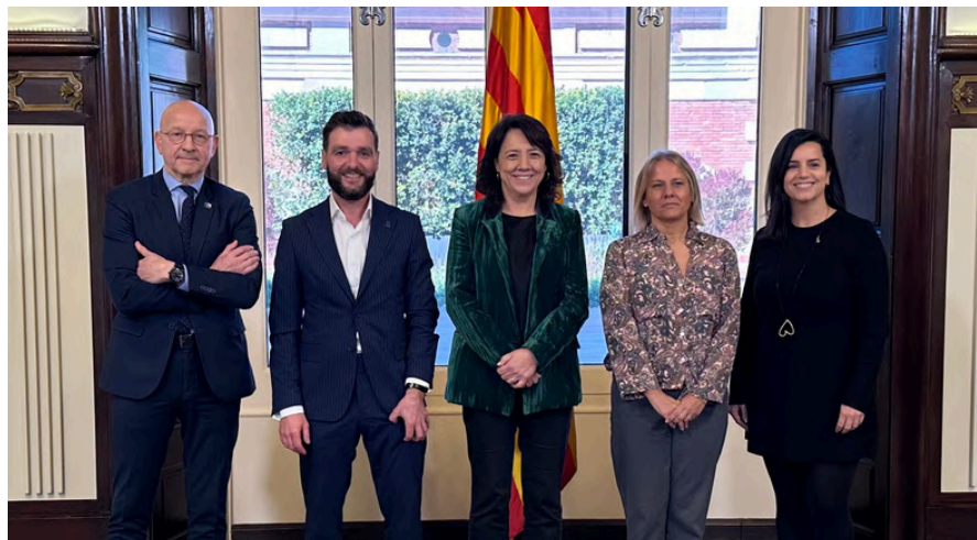
1 de març de 2024. Audiència amb la presidenta del Parlament de Catalunya, M. Hble. Sra. Anna Erra i Solà.