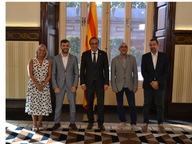
18 de juliol de 2024. Audiència amb el president del Parlament de Catalunya, el M.Hble. Sr. Josep Rull i Andreu.