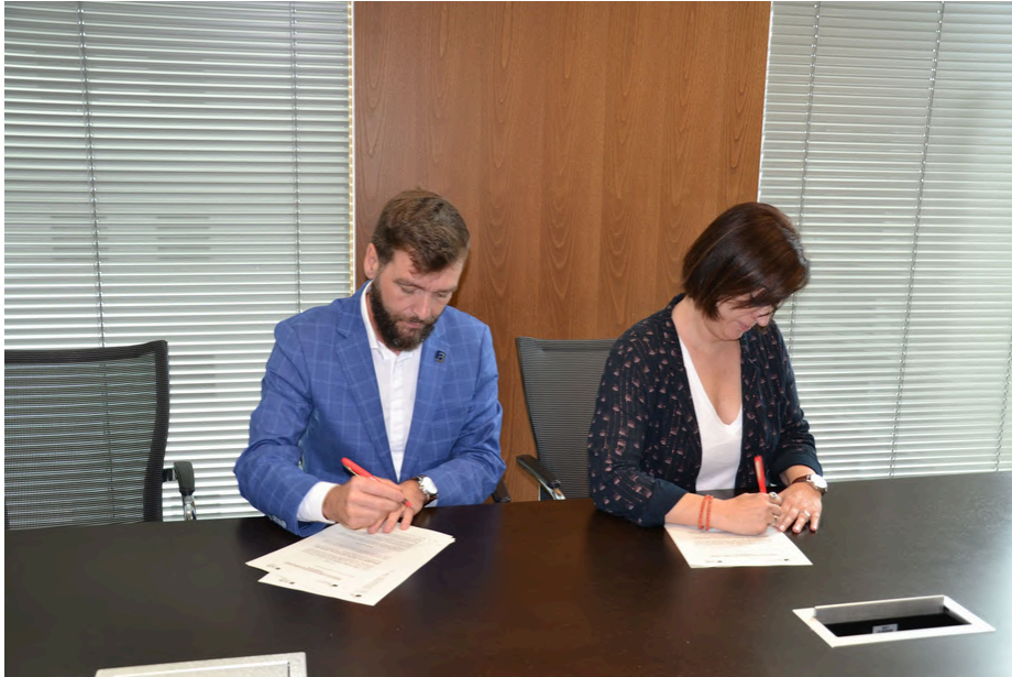
12 de juny de 2024 . Signatura d'un acord de col·laboració amb el Banc de Sang i Teixits.