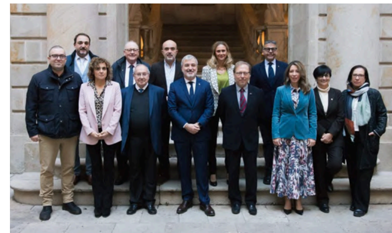
15 de desembre de 2023. Jornada Cambra Comerç BCN - Revitalizando el sector retail.