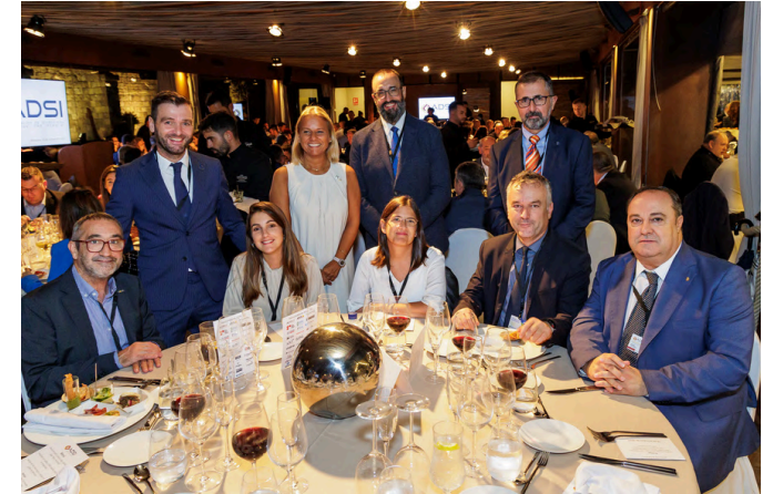
19 d'octubre de 2023. Sopar Insitucional i entrega de premis ADSI 2023.