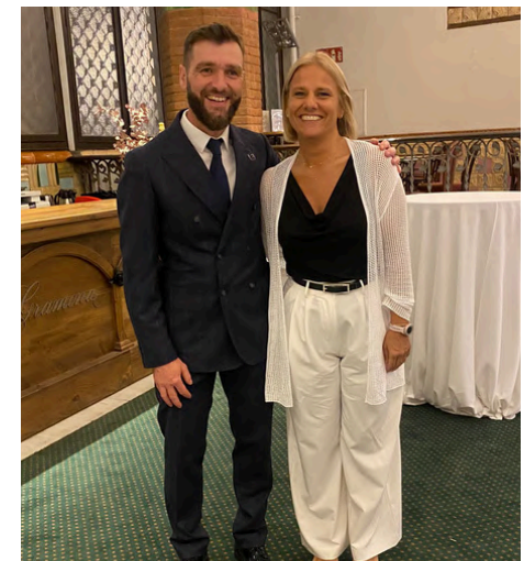
13 de juny de 2024. Nit de la seguretat.