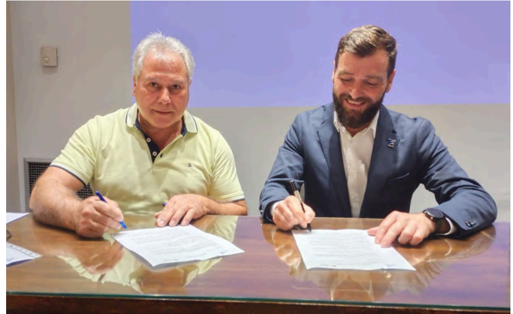
6 de juliol de 2024 . Signatura de conveni de col·laboració amb ASPEC.