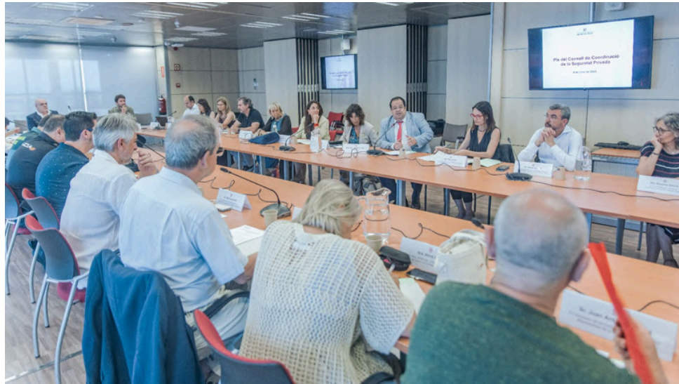
4 de juliol de 2023. Consell de Coordinació de la Seguretat Privada.