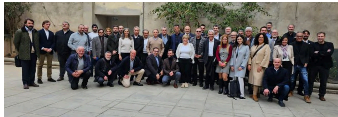
2 de febrer de 2024. Networking CONPYMES.