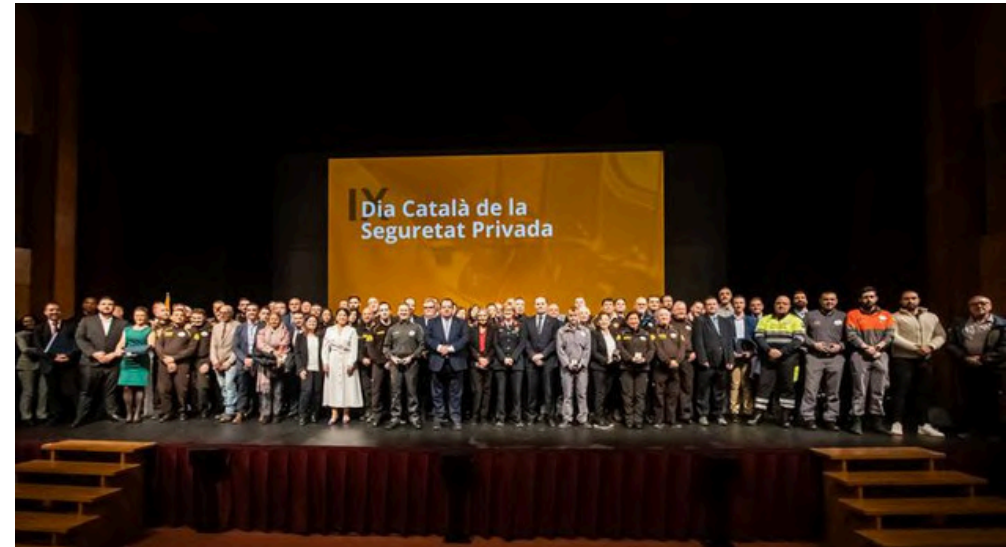
15 de desembre de 2023. Dia Català de la Seguretat Privada.