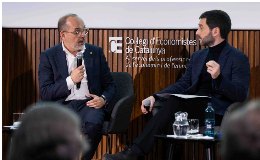
23 de febrer de 2024. Jornada Construïm futurs sostenibles.