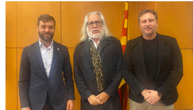
22 d'abril de 2024. Reunió amb Joan Jaume Oms, secretari general de Territori.