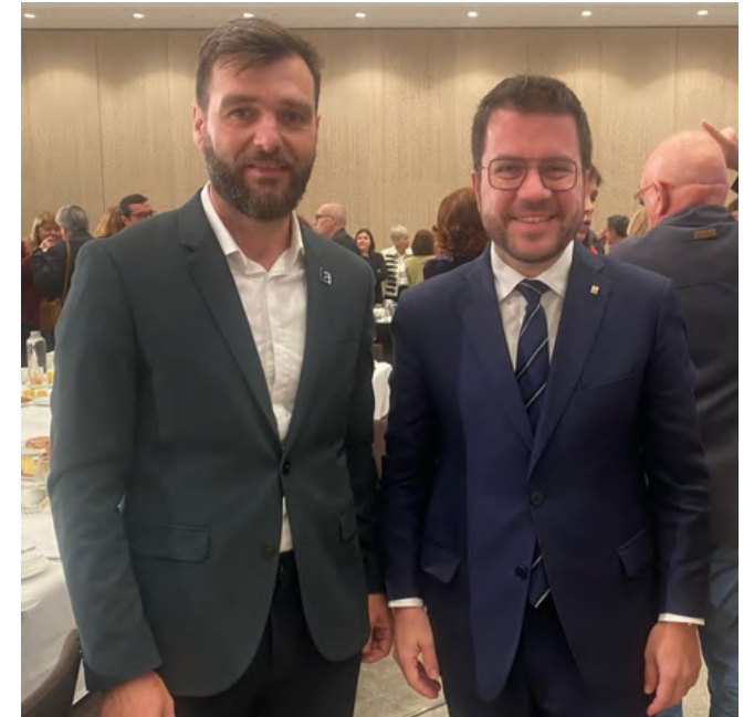
17 d'abril de 2024. Fòrum Europa Tribuns Catalunya amb el M.H. Sr. Pere Aragonès i Garcia.