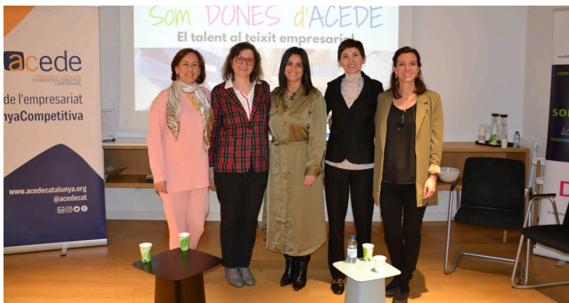
6 de març de 2024. Som Dones d'ACEDE.