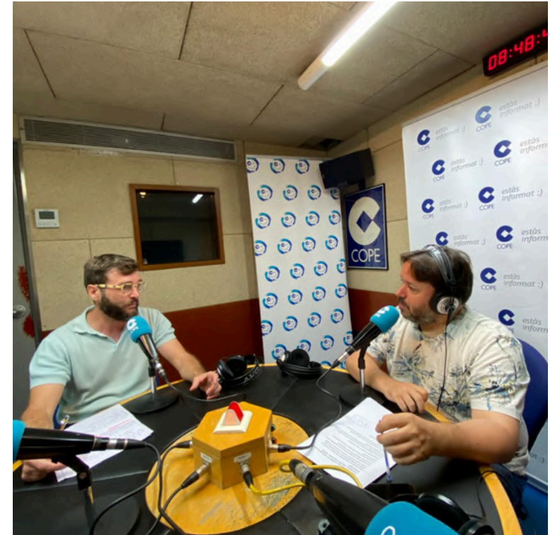
14 de juliol de 2024. Entrevista COPE Duros a 4 pessetes: Com afecta a les empreses la reducció de la jornada laboral?