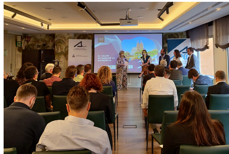
4 de juny de 2024. ASPEC Conecta: El valor de marcar la diferencia.