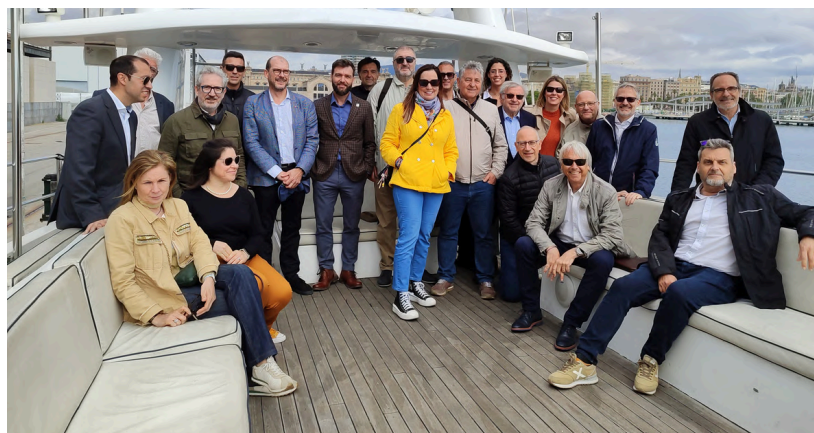
17 de maig de 2024. Visita al Port de Barcelona.