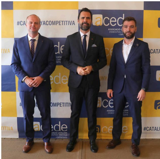
15 de novembre de 2023. I Col·loqui #CatalunyaCompetitiva amb Roger Torrent.