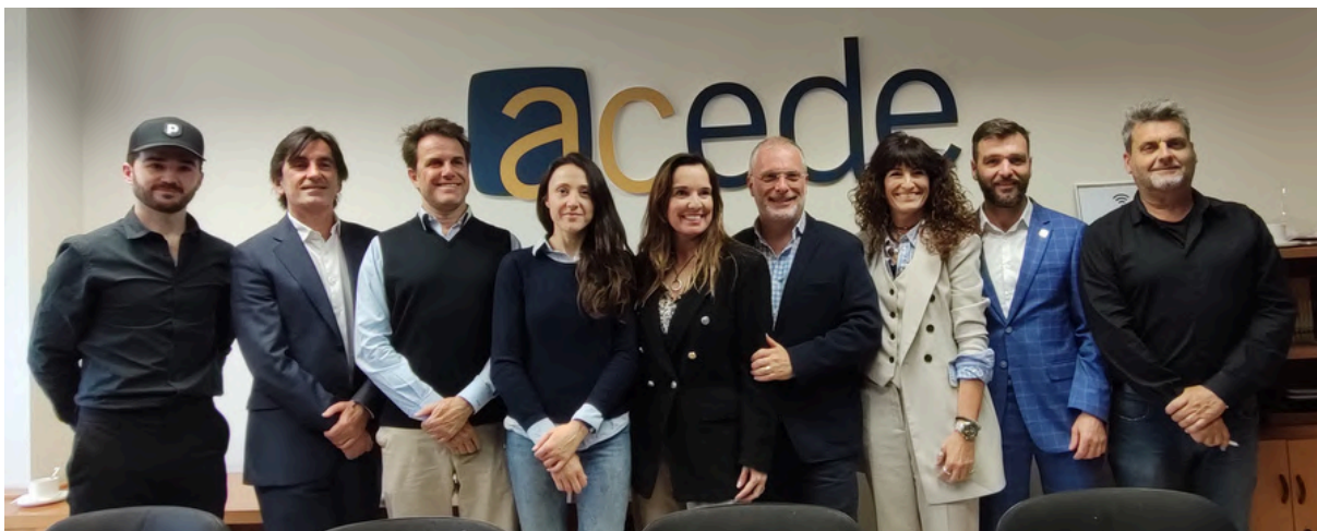
9 d'abril de 2024. 1a reunió del grup de Turisme, Tecnologia i Sostenibilitat.