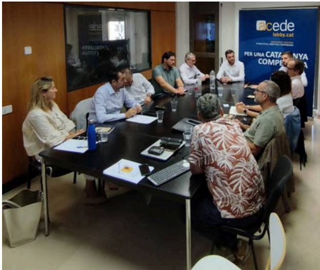
27 de setembre de 2023. Reunió Junta Directiva Extraordinària.