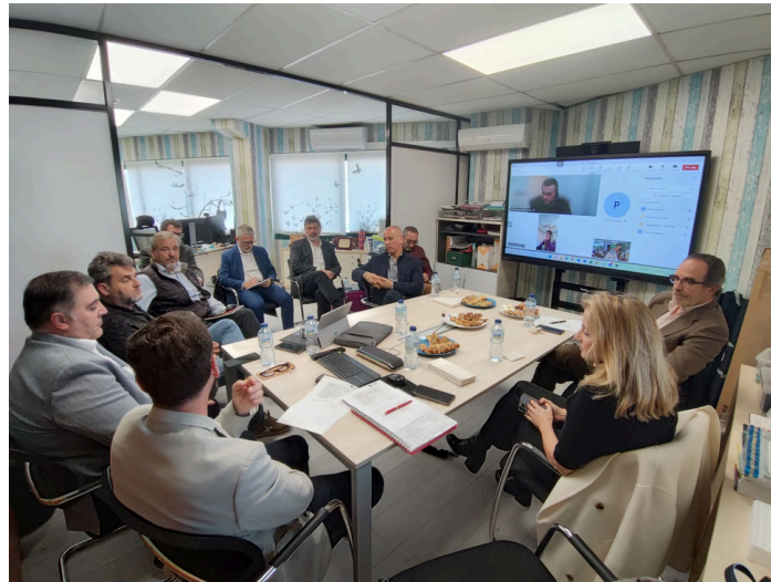
19 de març de 2024. Reunió i dinar Junta Directiva ACEDE.