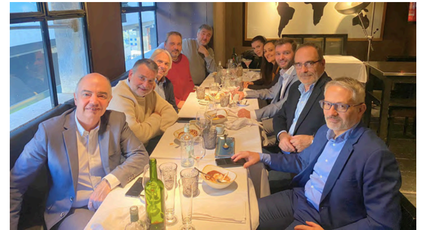
15 de desembre de 2023. Dinar Nadal Grup Assessoria.