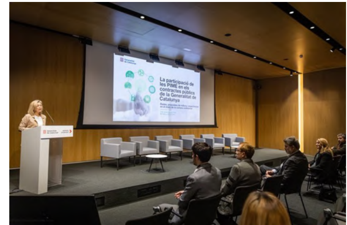
1 de desembre de 2023. Jornada "La participació de les PIME en els contractes públics de la Generalitat de Catalunya".